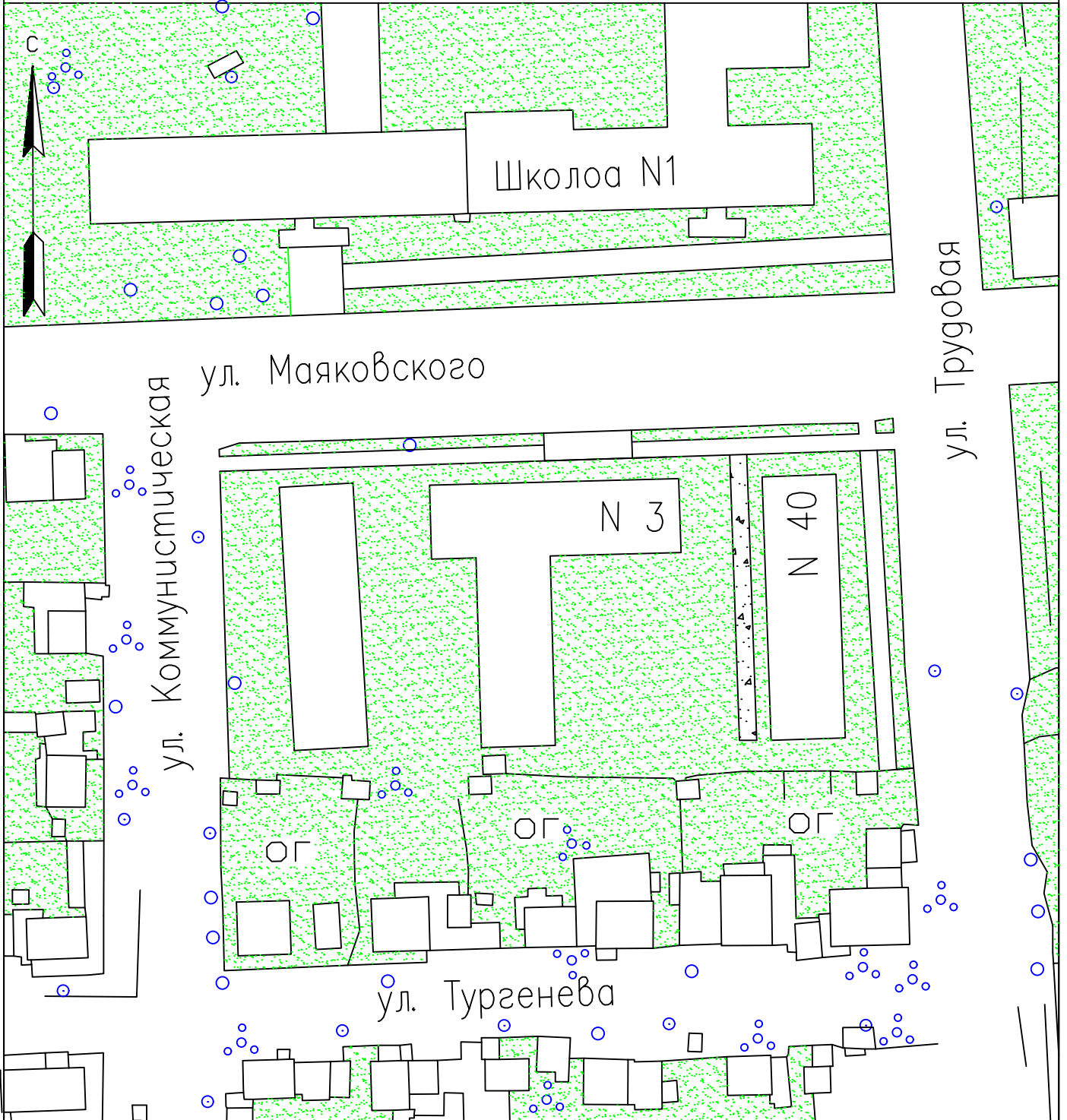
Схема обустройства дворовой территории в г. Добрянка (ул. Трудовая, д.40)