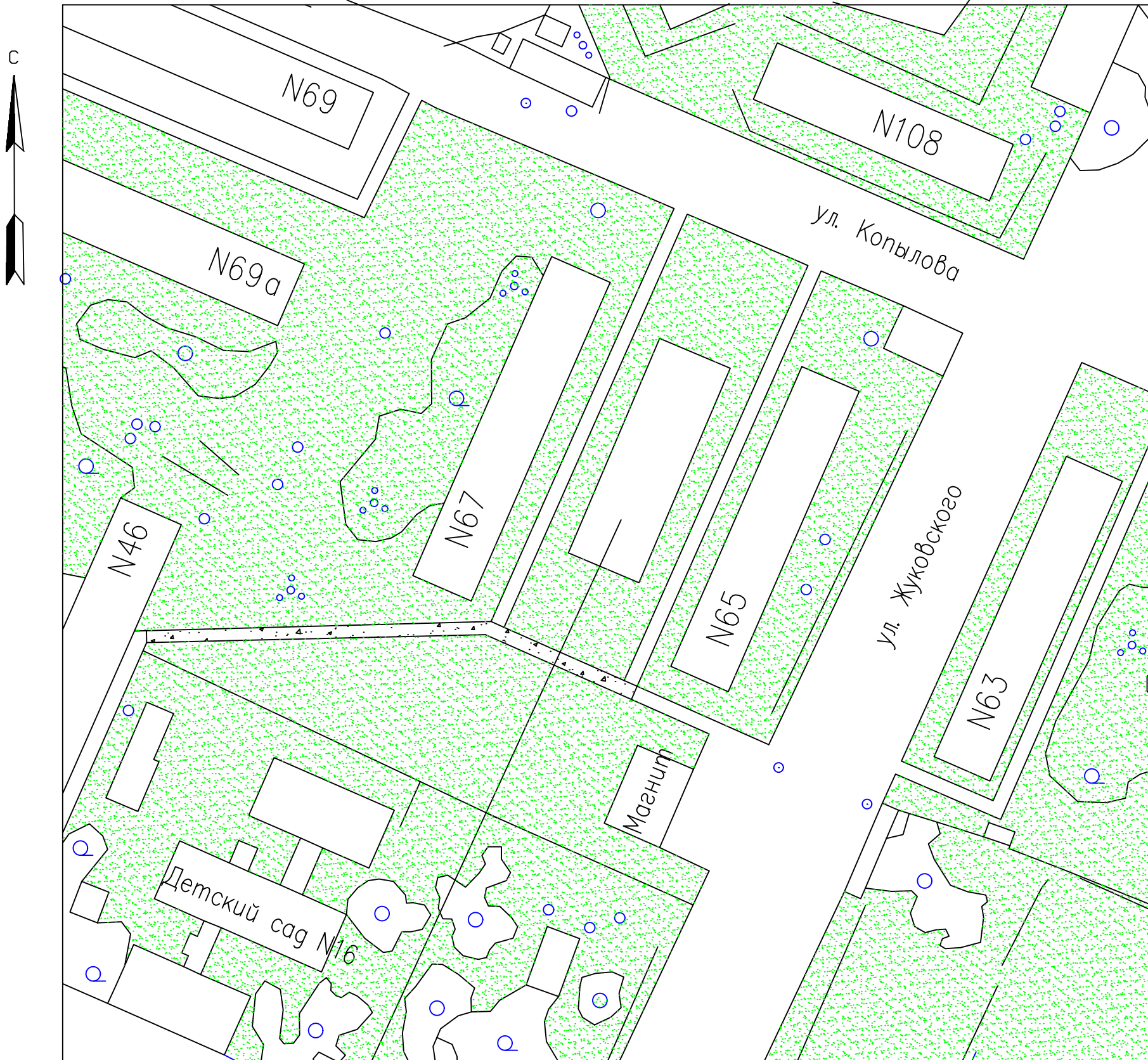
Схема обустройства дворовой территории в г. Добрянка (ул. Копылова д.67, 65)

Место для размещения детской игровой площадки