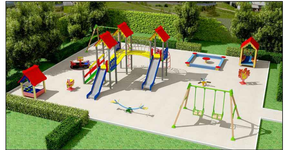
Пример Детской игровой площадки

Место для размещения детской игровой площадки