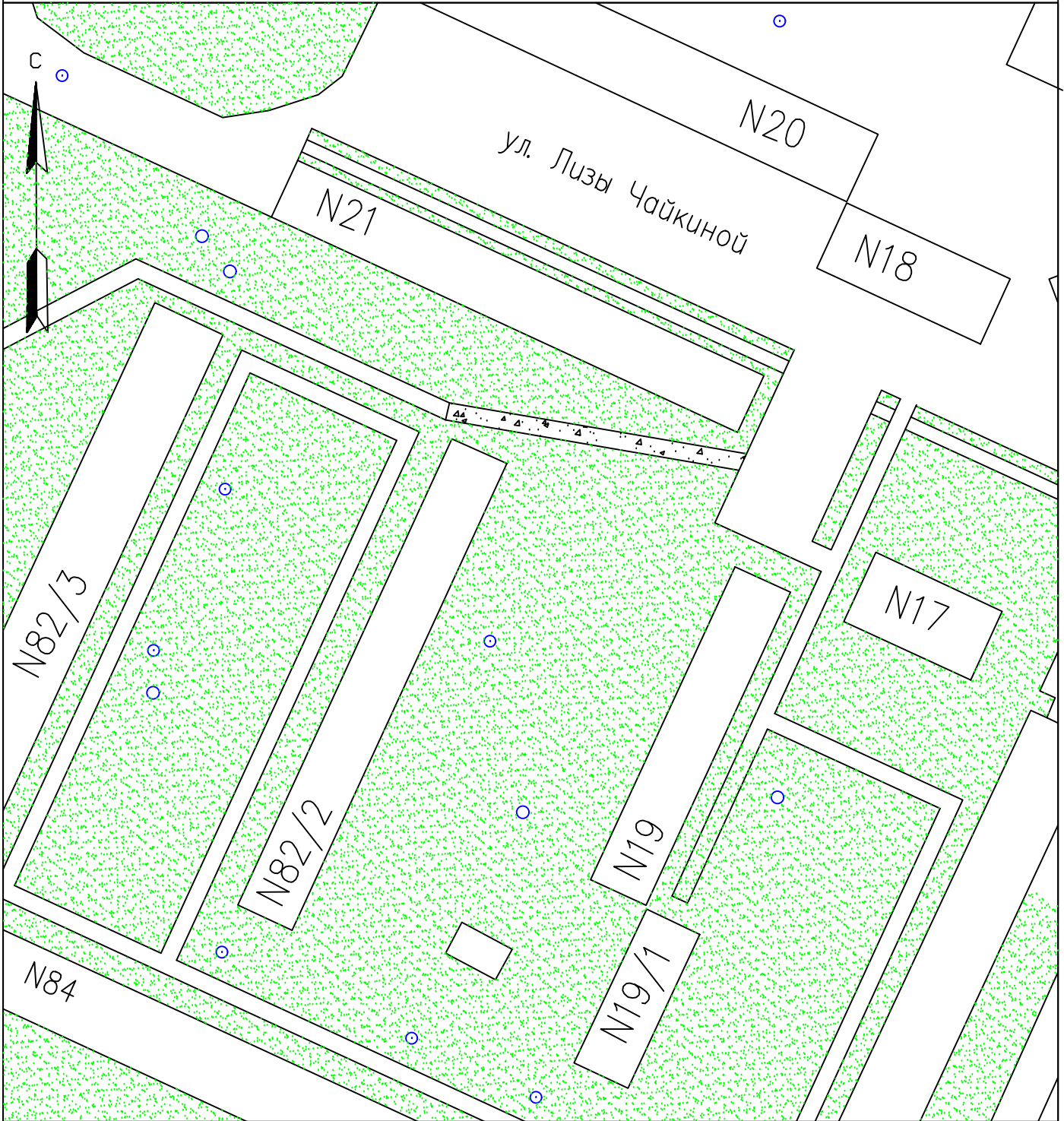
Схема обустройства дворовой территории в г. Добрянка (ул. К.Маркса, д.82/2; ул. Л. Чайкиной, д.21)